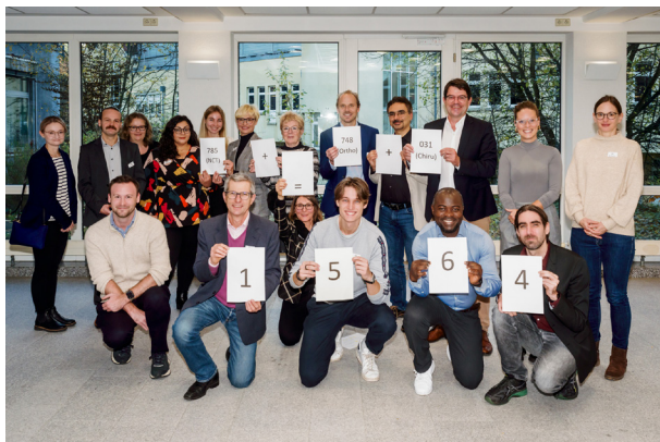
Teamfoto vom SarcBOP-Samstag 2023 1564 Teilnehmer: Innen aus Chirurgie, NCT, Orthopädie